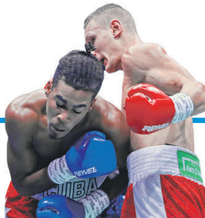
СПОРТИВНАЯ ФЕДЕРАЦИЯ БОКСА САНКТ-ПЕТЕРБУРГА

В ПЕТЕРБУРГЕ СУЩЕСТВУЮТ СЕРЬЕЗНЫЕ ПЛАНЫ ПО РАЗВИТИЮ БОКСА, ПОДТВЕРЖДЕНИЕМ ЭТОГО СТАЛ МАТЧ СБОРНЫХ РОССИИ И КУБЫ. → стр. 7