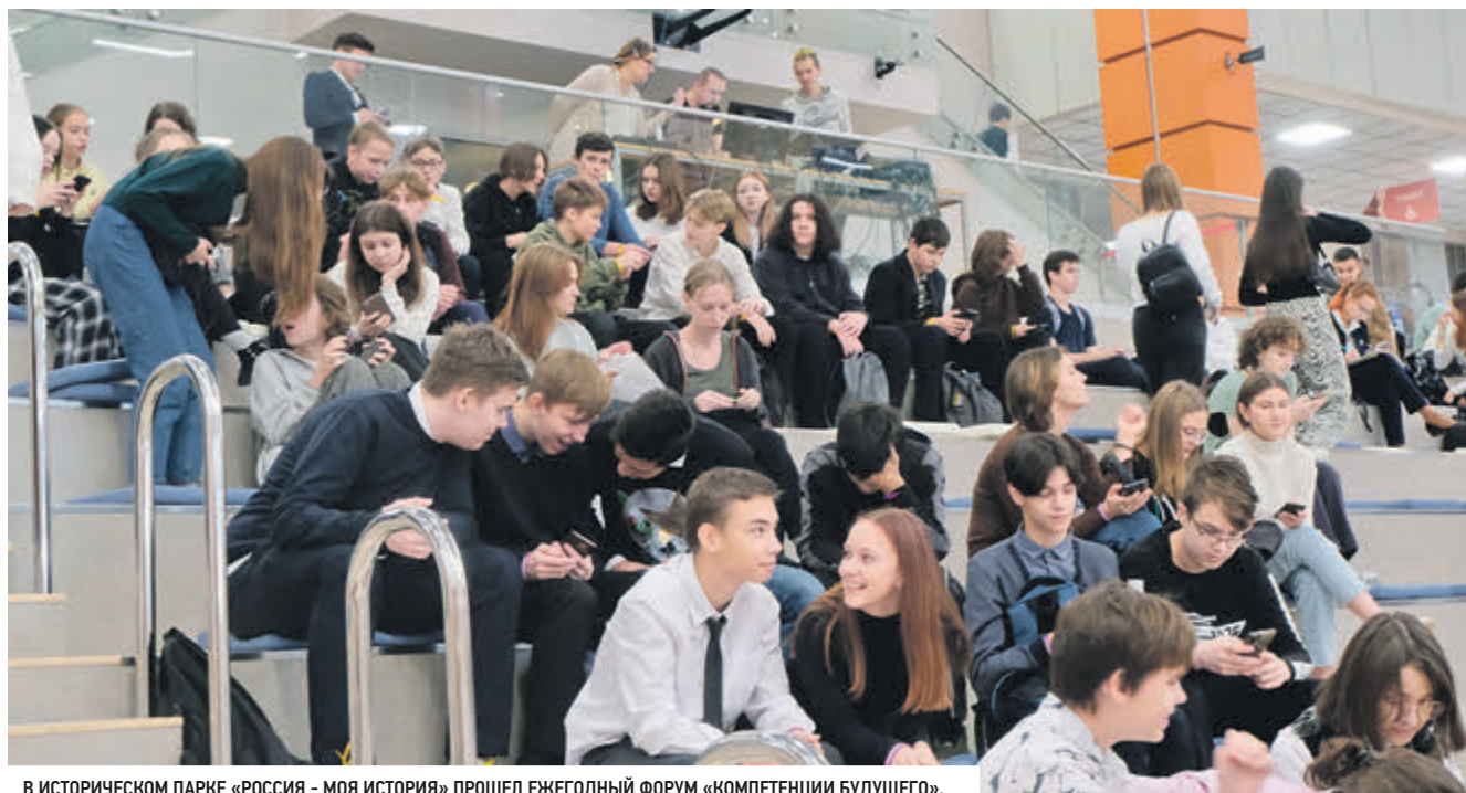
В ИСТОРИЧЕСКОМ ПАРКЕ «РОССИЯ - МОЯ ИСТОРИЯ» ПРОШЕЛ ЕЖЕГОДНЫЙ ФОРУМ «КОМПЕТЕНЦИИ БУДУЩЕГО».

К слову, Центр занятости проводит бесплатные консультации по профори-